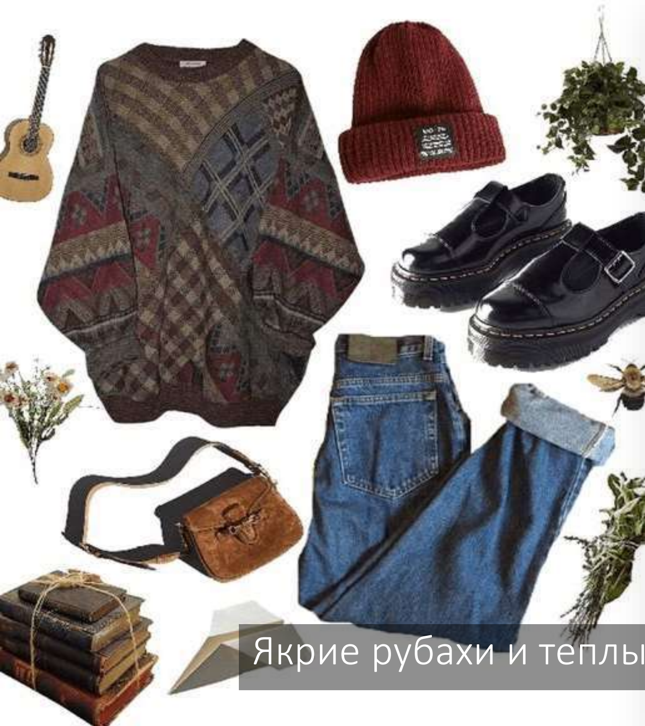
Якрие рубахи и теплые шерстяные свитеры